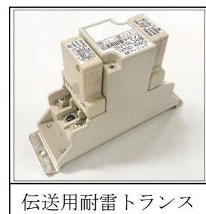
伝送用耐雷トランス