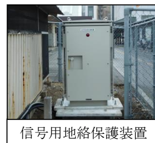
信号用地絡保護装置