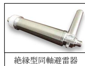
絶縁型同軸避雷器